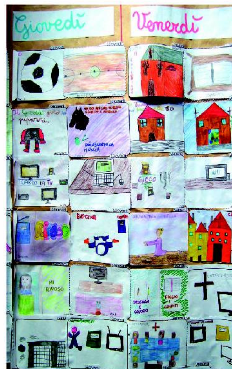
Il tempo libero rappresentato dai bambini.